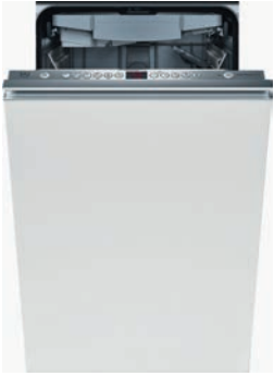
Geschirrspüler (45 cm) V-Zug, Adorina-SVi