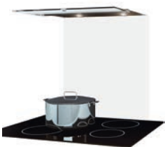
Dampfzug (60 cm) Einbauhaube Wesco, WESCO EVME 211-60 Uml