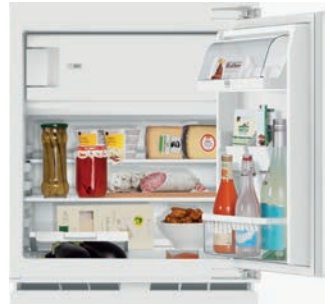
Kühlschrank mit integriertem Gefrierfach 18 l (60 cm) V-Zug, Komfort 60i