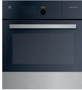
Kombisteamer (60 cm) V-Zug, Combair-Steam SL