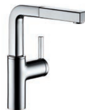
Armatur Spülbecken KWC Ava Chrom, A205 mit Auszugsbrause