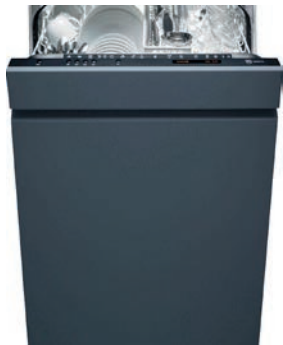
Geschirrspüler (60 cm) V-Zug, Adora SL