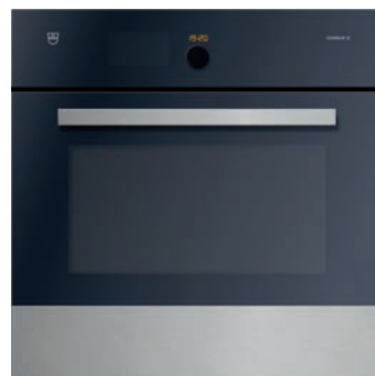
Backofen V-Zug, Comair SL