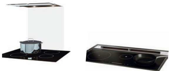
Dampfzug (90 cm) Einbauhaube WESCO, WESCO EVME 211-90 Uml oder Tischhaube, WESCO WESCO ML basso I Uml