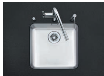
Spülbecken Suter Gastro Star, GS 45 U