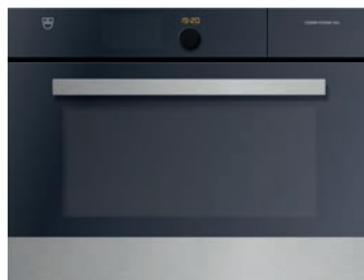
Kombisteamer (60 cm) V-Zug, Combi-Steam XSL