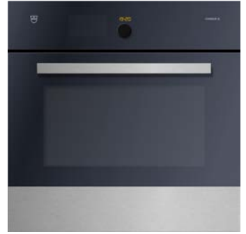
Backofen V-Zug, Comair SL