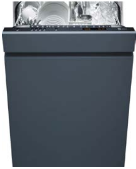
Geschirrspüler (60 cm) V-Zug, Adora SL