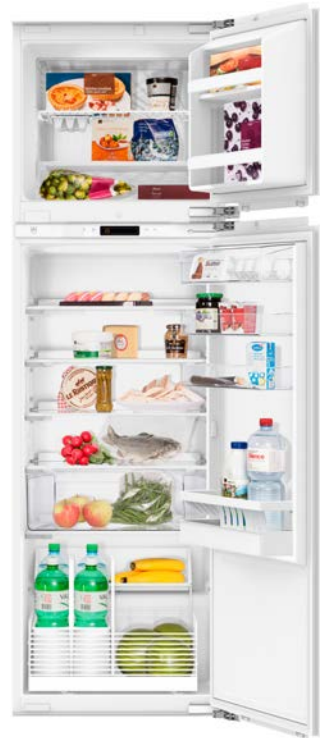
Kühlschrank mit separatem Gefrierfach 68 l V-Zug, Noblesse 60i eco