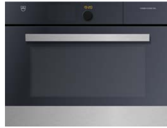
Kombisteamer (60 cm) V-Zug, Combi-Steam XSL