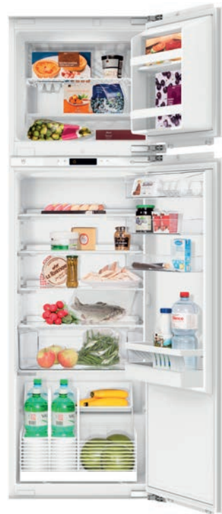
Kühlschrank mit separatem Gefrierfach 68 l V-Zug, Noblesse 60i eco