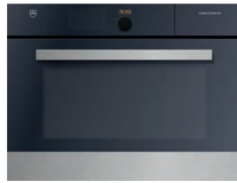
Kombisteamer (60 cm) V-Zug, Combi-Steam XSL