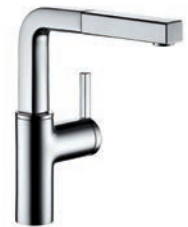
Armatur Spülbecken KWC Ava Chrom, A205 mit Auszugsbrause