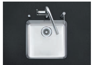
Spülbecken Suter Gastro Star, GS 45 U