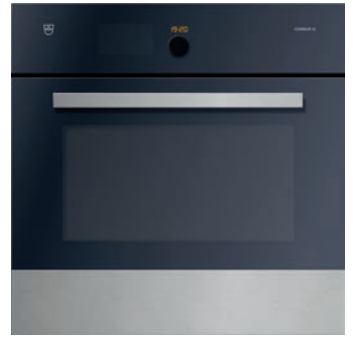
Backofen V-Zug, Comair SL