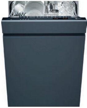
Geschirrspüler (60 cm) V-Zug, Adora SL